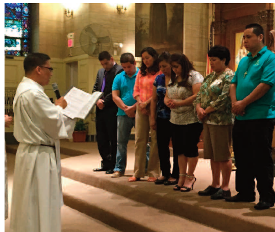
Una ceremonia de comisionamiento en la parroquia de la Santísima Trinidad.

Más de 200 líderes (agentes pastorales) están involucrados en 50 parroquias hispanas. Este ministerio también se desarrolla en 6 parroquias polacas.